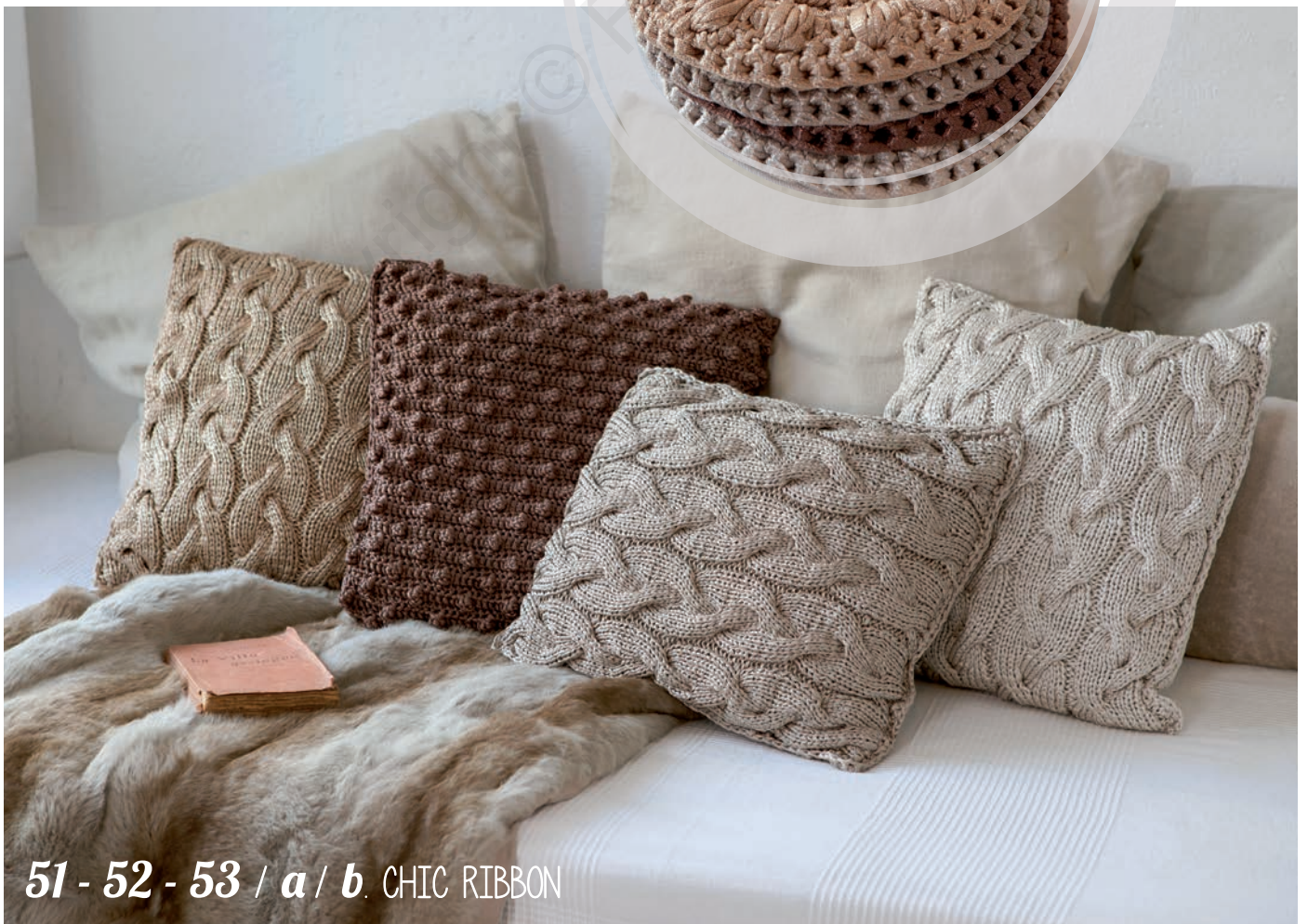
51 - 52 - 53 / a / b CHIC RIBBON